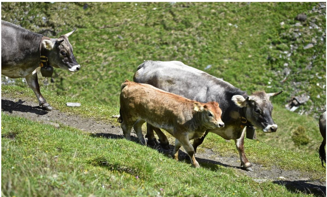
Abb. 1: Die Kuh Flora mit ihrem Kalb auf der Weide oberhalb des Alpbetriebs in Disentis

Sie ergänzen den Bericht mit einem Foto, das Sie während dem Landwirtschaftspraktikum gemacht haben. Dieses Foto hat eine Legende. Die Legende ist sachlich formuliert (nicht in Ich-Form). Sie notieren in der Legende ausserdem, wer das Foto gemacht hat (ihren Vor- und Nachnamen) und wann es gemacht worden ist (siehe Beispiel unten). Wählen Sie ein gutes und passendes Foto aus und machen Sie sich Gedanken zum Layout des Fotos: Was wirkt am besten? Wie gross soll dieses Foto sein? An welcher Stelle im Text soll es stehen (am Anfang? am Schluss? in der Mitte?)