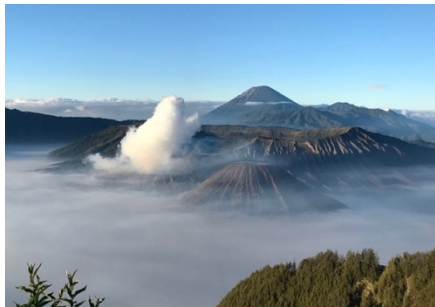
Abbildung 1: Vulkan Mount Bromo in Indonesien 4