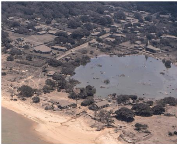
Als wäre es ein Schwarzweissbild: Ein mit Asche bedecktes Siedungsgebiet auf Tonga nach dem Vulkanausbruch.

Bevor der Vulkan das Internet und die Telefonverbindungen im Inselstaat zusammenbrechen liess, war auf Videoaufnahmen noch zu sehen, wie die Flutwelle des Tsunami den königlichen