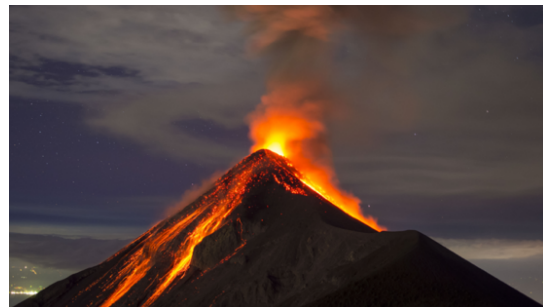
Abbildung 2: Vulkanausbruch 5